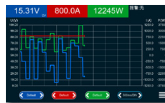
带图形描绘功能的 TFT触摸屏举例